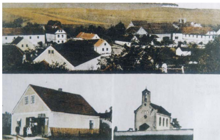
Nahoře částečný pohled na obec; vlevo dole obchod Olbert, vpravo dole kostel Petra a Pavla.

Obcí a její částí protéká řeka Goldbach, zde nazývaná Lubenzer Bach (dnes Blšanka), která je na druhé straně zesílena řekou Leschkauer Bach. Pole na obou březích jsou úrodná, ale jen malá část z nich je rovinatá; zdaleka největší část leží na svazích s více či méně strmými břehy a je vystavena splachům při deštích. Chráněná poloha a příznivé klima umožňují pěstovat všechny druhy obilovin, největší péče je věnována chmelu a nedostatek luk musí nahradit polní pícniny.