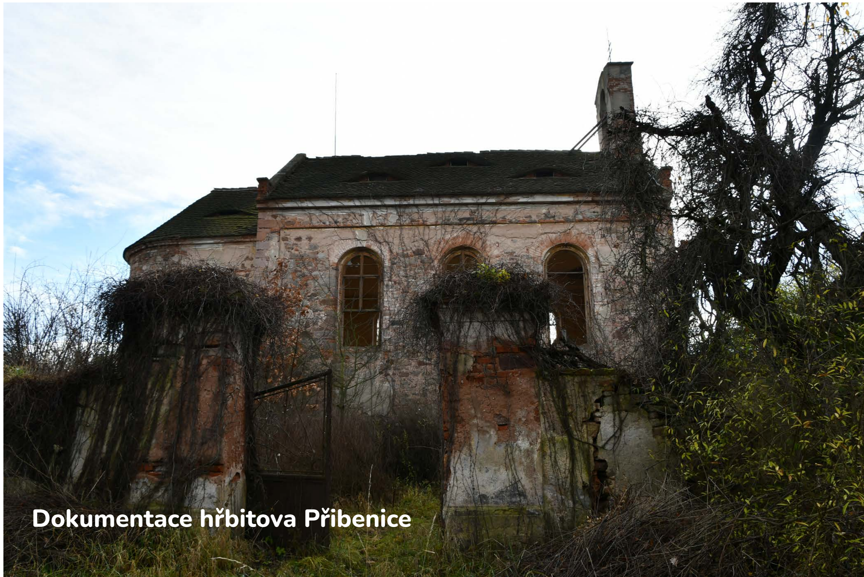
Dokumentace hřbitova Přibenice